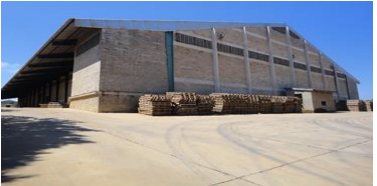
Picha Na.2: Ghala la kuhifadhia Nafaka