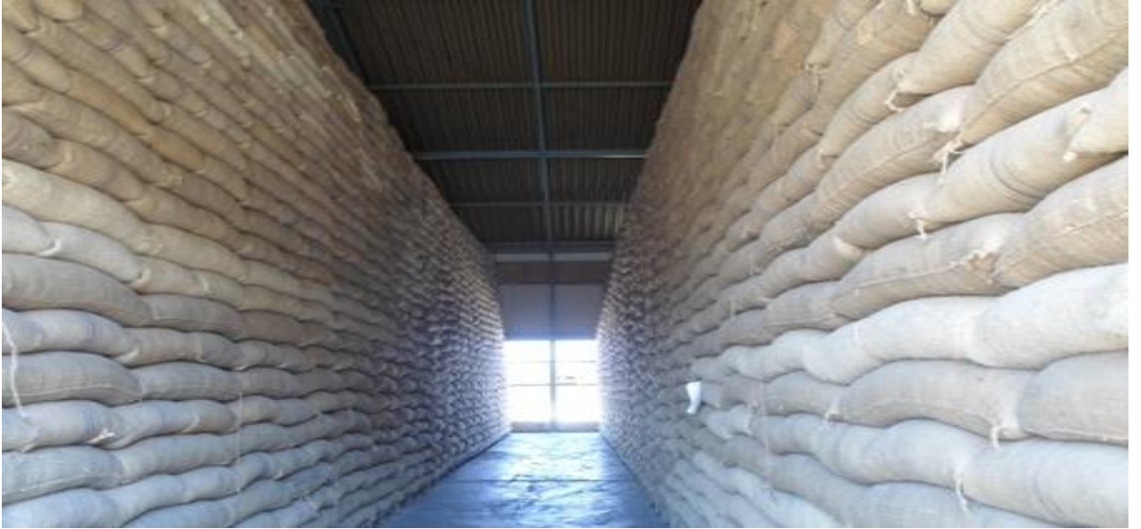
Picha Na. 1: Magunia ya mahindi yaliyohifadhiwa vizuri katika ghala